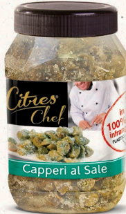
Kapern in Salz 900 g