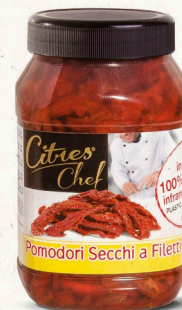
Sonnengetr. Tomatenfilets 980 g