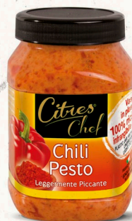
Chili Pesto 1.000 g