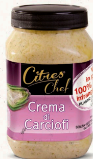
Artischockencreme 970 g