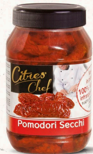
Sonnengetrocknete Tomaten 980 g