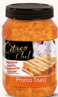
Sandwich Aufstrich 960 g