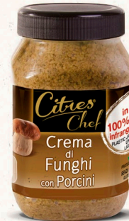
Steinpilzcreme 970 g